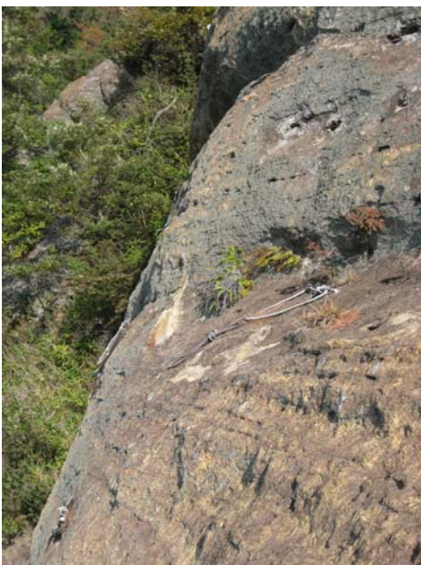
作業エリア1の終了点